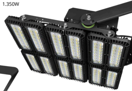
bis zu up to 154lm/W