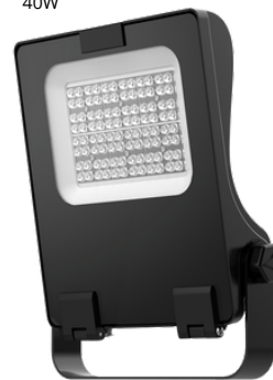
STAR Flood 40W