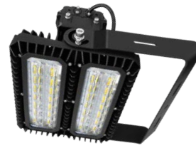
STAR Sport Gen. 3 230W